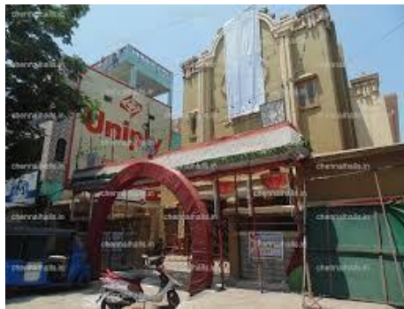
அறிவுகத்தின் இன்றைய நிலை

அண்ணா முதலில் நடத்திவந்த பத்திரிக்கை, திராவிட நாடு. ஆங்கிலத்தில் ஹோம்ரூல் என வெளிவந்தது. திராவிட நாடு பத்திரிக்கையின் உரிமம் முடிந்த பிறகு, அண்ணா 'காஞ்சி' பத்திரிக்கையைத் தொடர்ந்து நடத்தி வந்தார்.