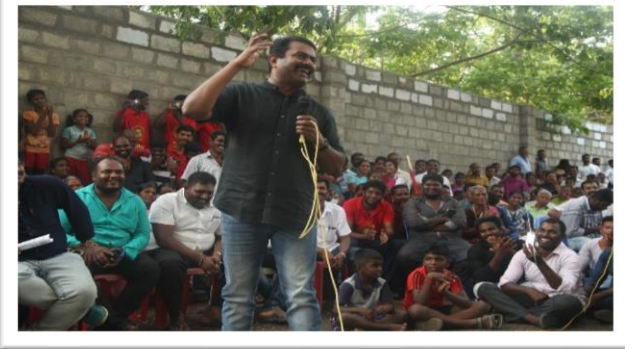
எட்டுவழிச் சாலை போராட்டம்